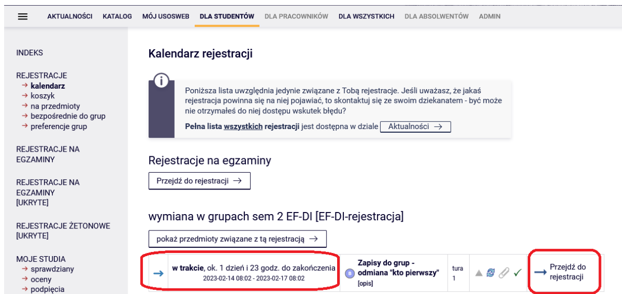
Rys. 2 Kalendarz rejestracji

Zostanie wyświetlona lista rejestracji, z którą powiązana jest osoba zalogowana.